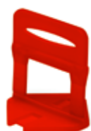
3 mm Código: 5194