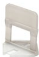
1,5 mm Código: 5193