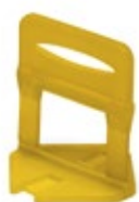
2 mm Código: 5193