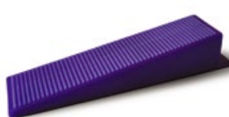
Nivela cerámicos de 3 mm a 12 mm de espesor. Código: 5291